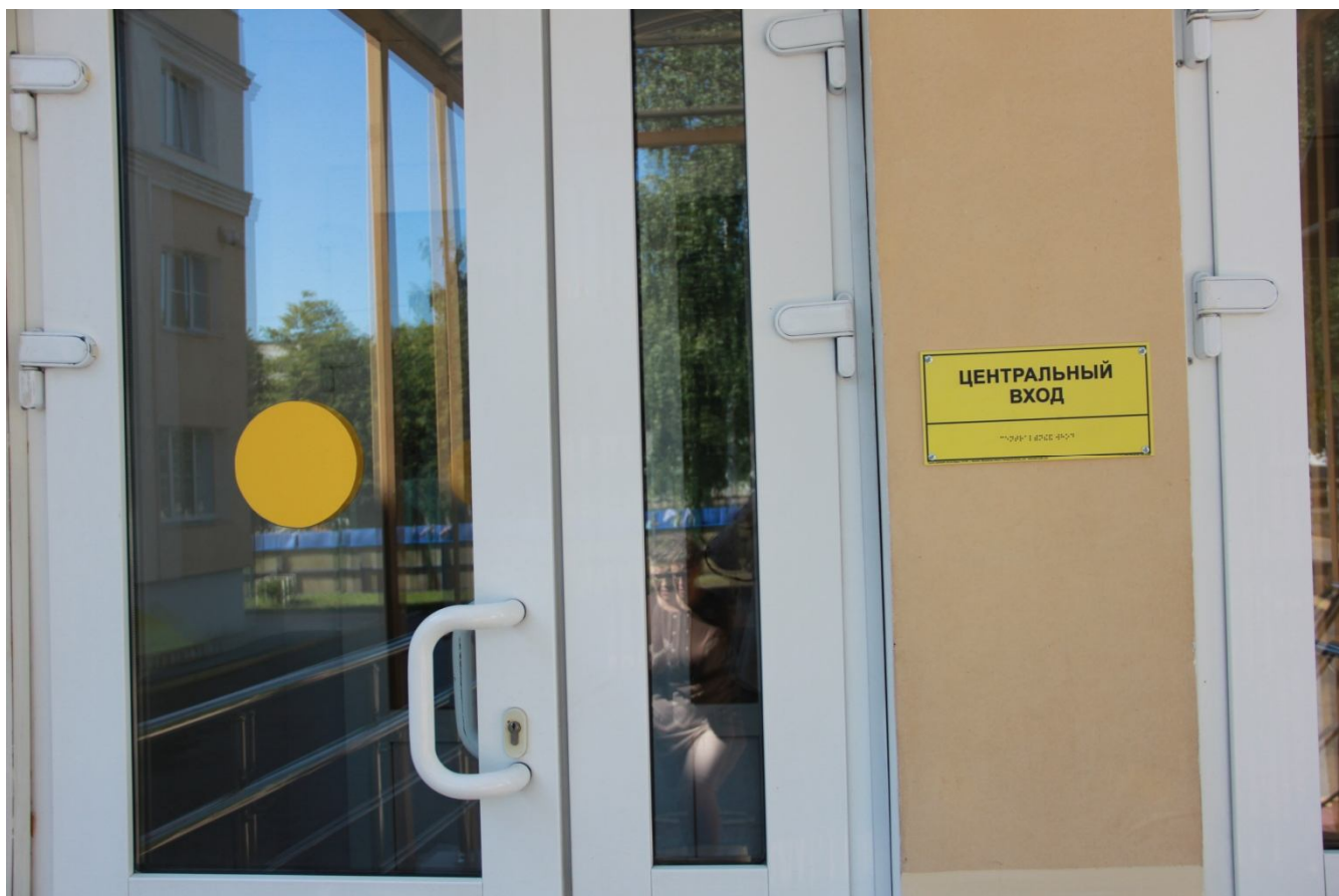
Центральный вход с универсальной информационной табличкой и маркировкой, предупреждающей о препятствии входа (выхода) в здание