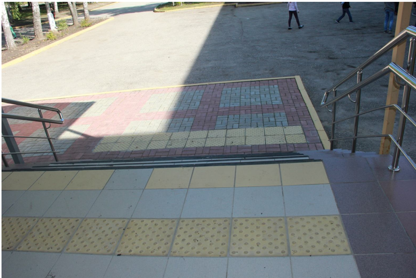
Лестница центрального входа с двухуровневыми перилами и тактильными предупреждающими указателями, выделенными цветом краями ступеней