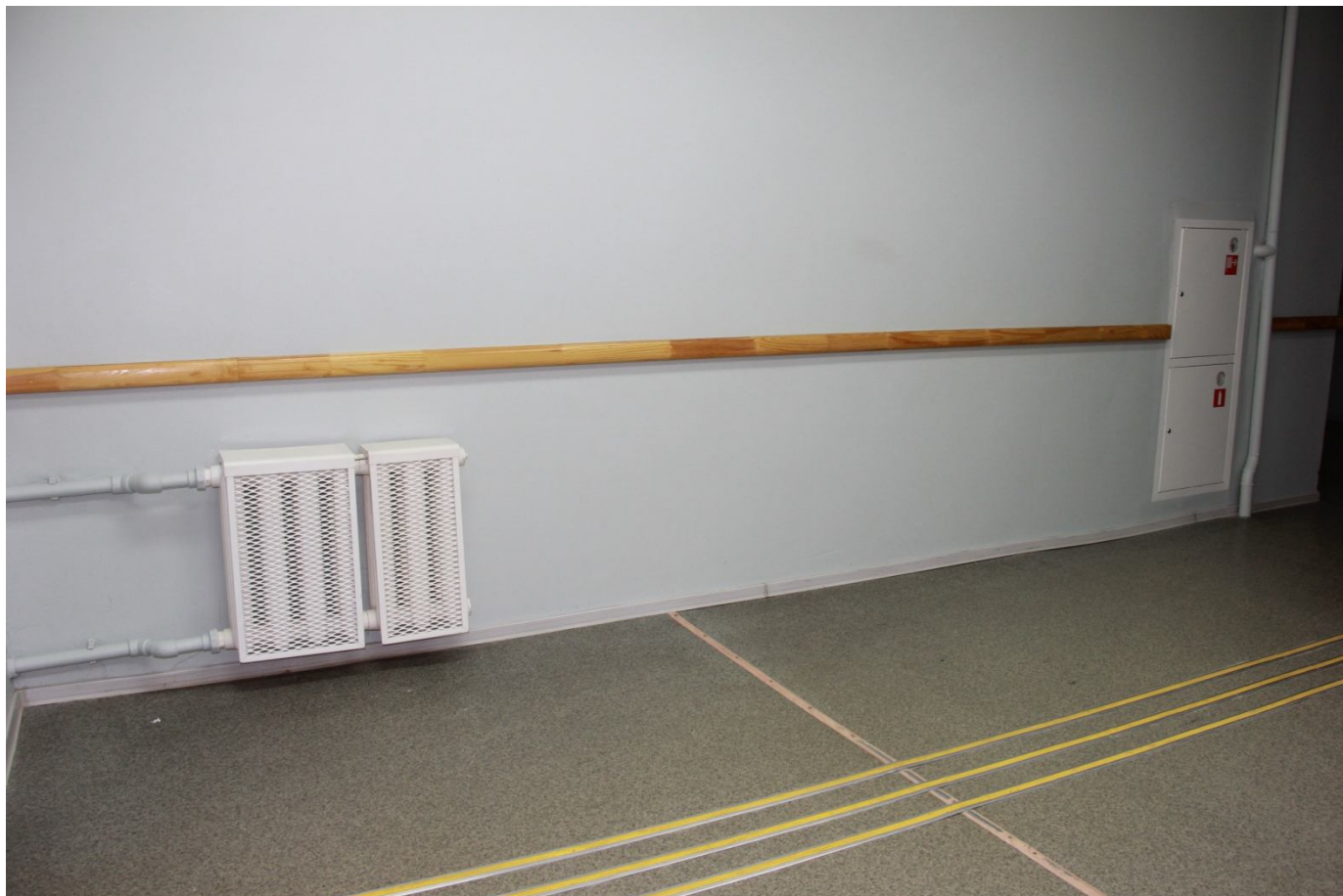
Напольные тактильные направляющие полосы и поручни – направляющие вдоль стен