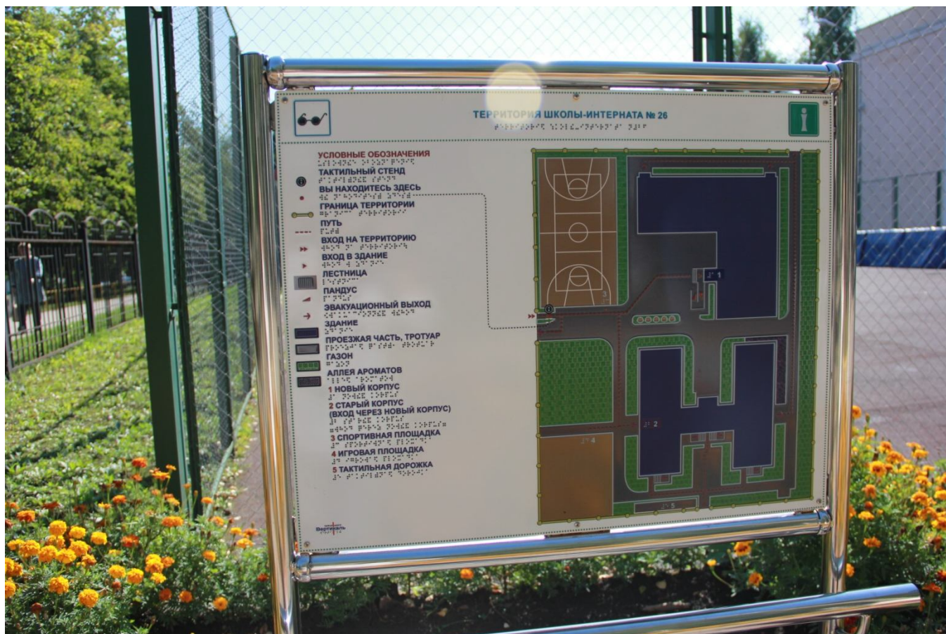
Тактильная мнемосхема у входа на территорию