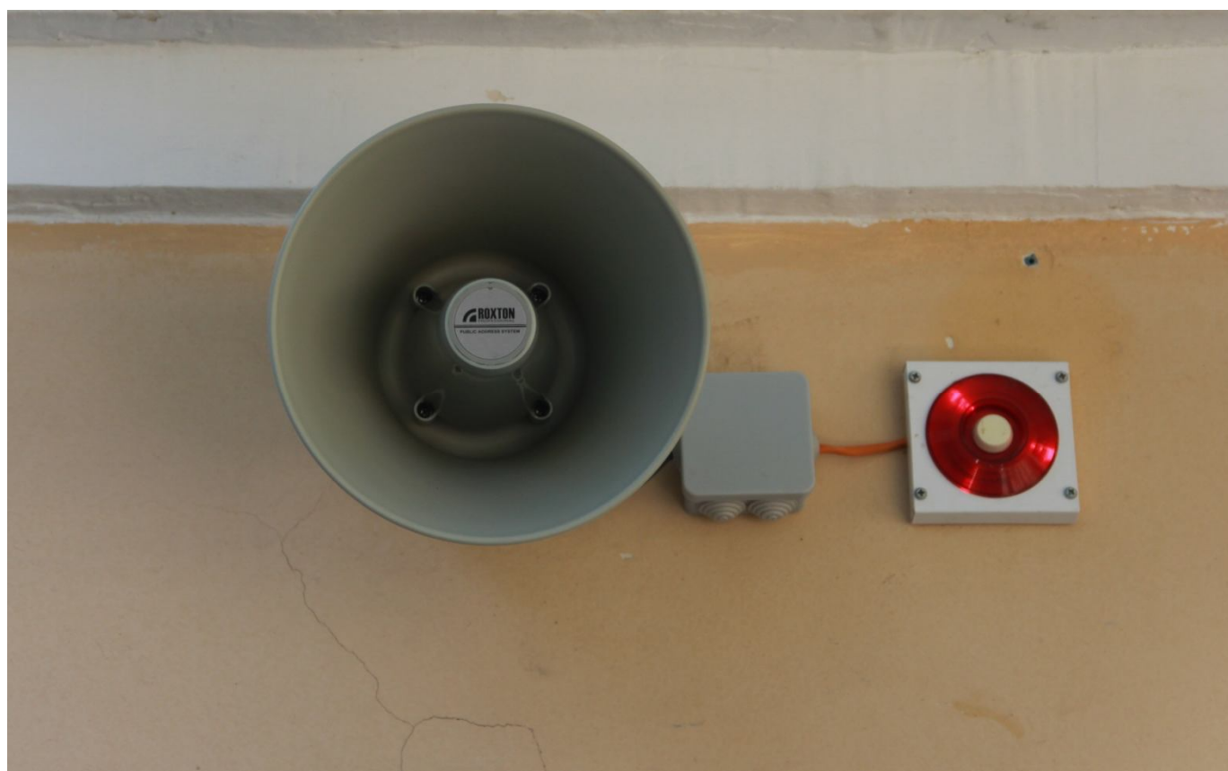
Звуковой маяк на входной площадке у входа