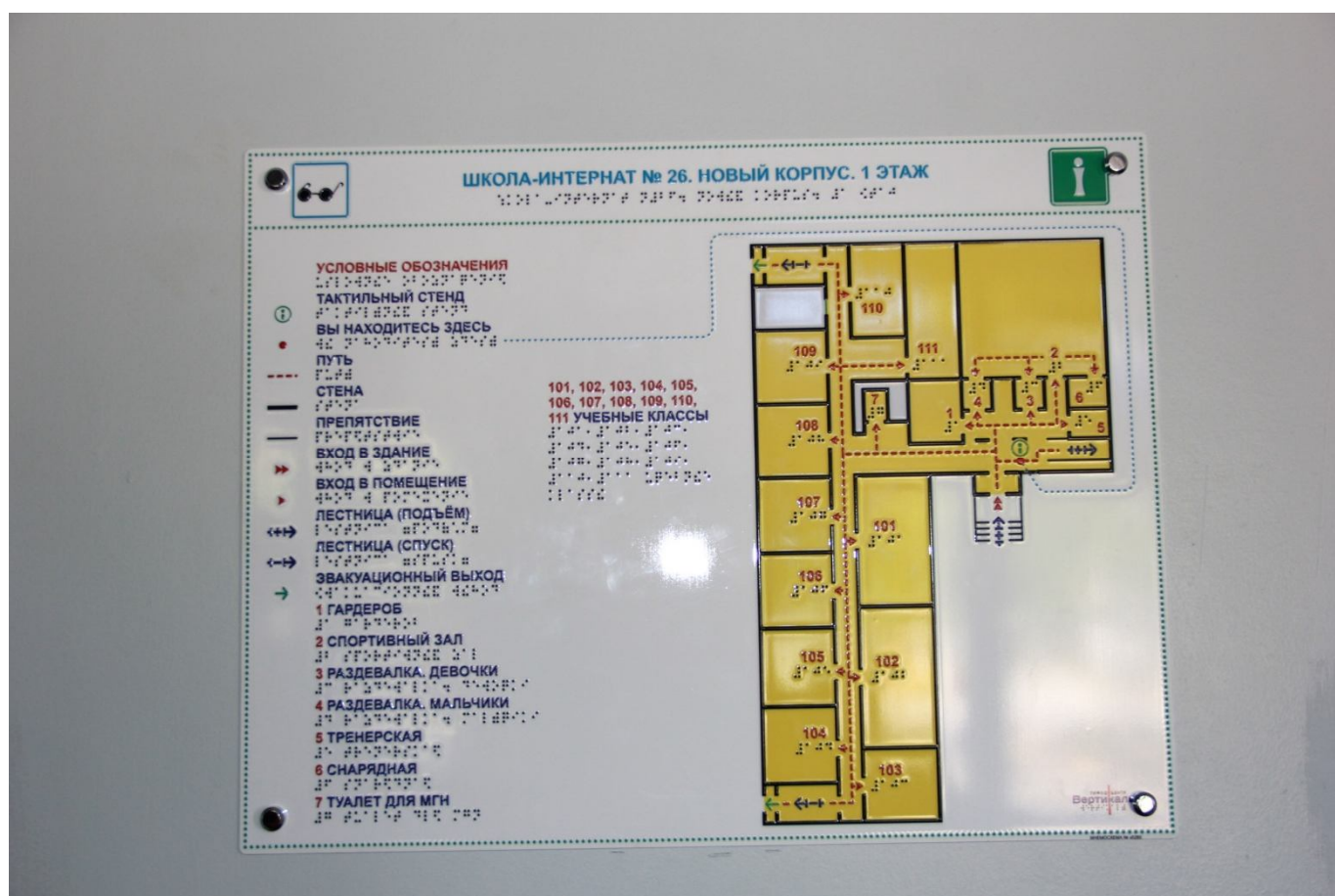
Тактильные мнемосхемы этажей