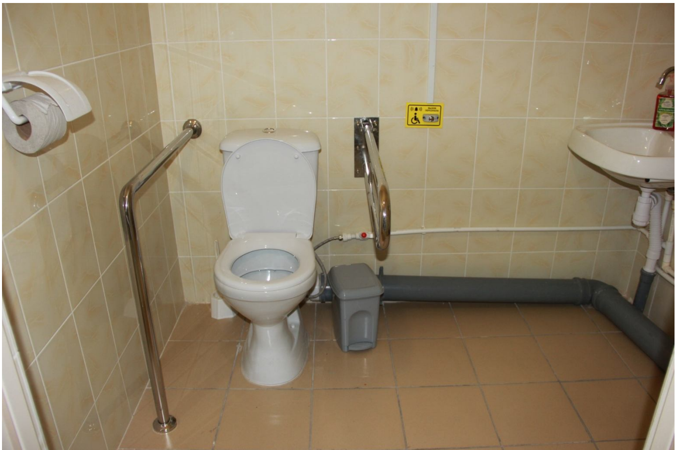
Санузел для МГН