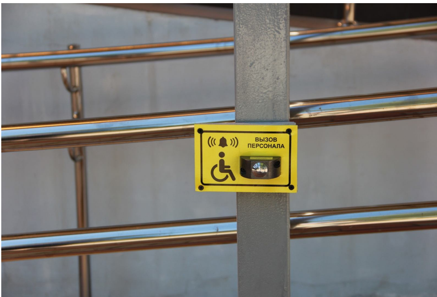
Пандус с двухуровневыми перилами к главной лестнице с кнопкой вызова персонала (для МГН)