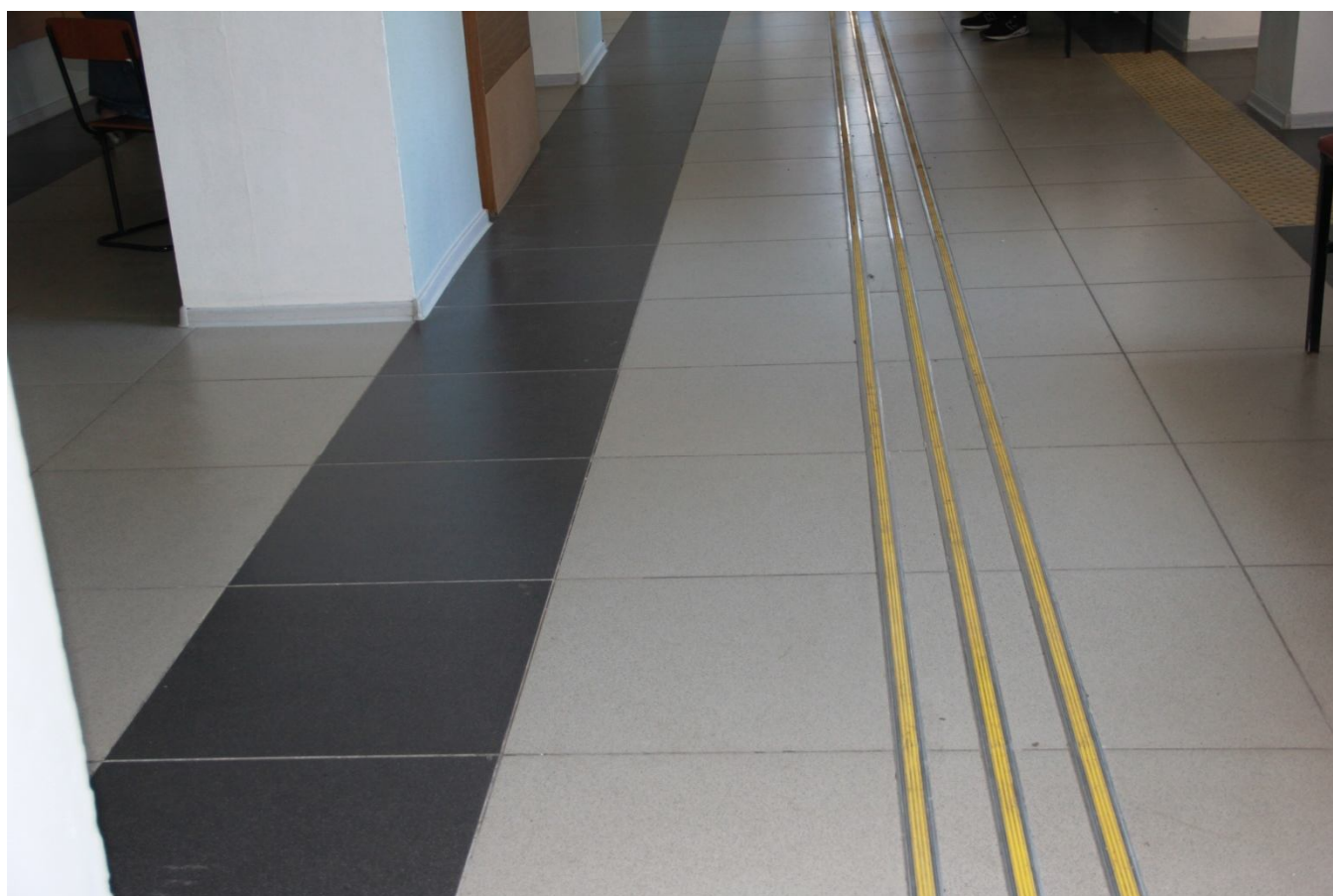
Напольные тактильные направляющие полосы и предупреждающие указатели