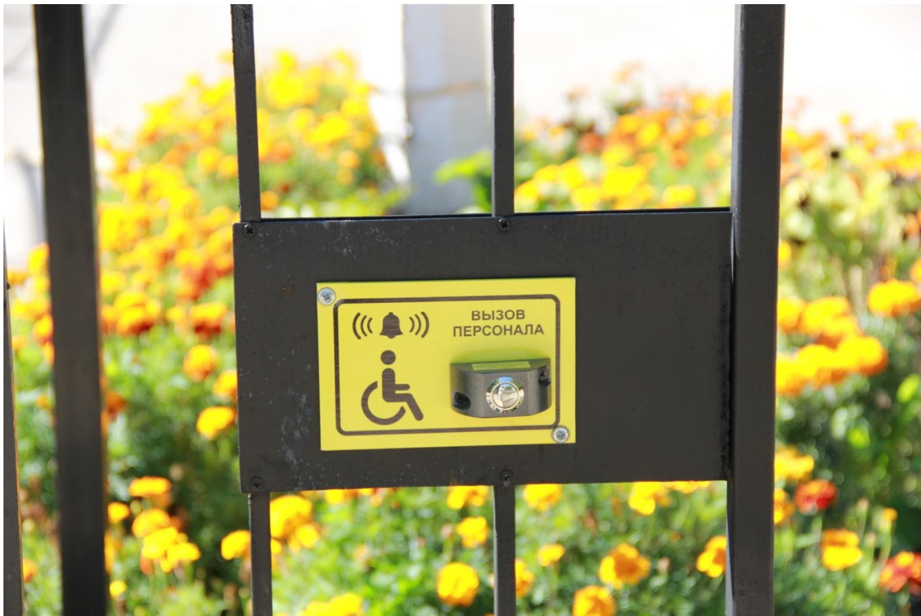
Кнопка вызова персонала у входа на территорию (для МГН)