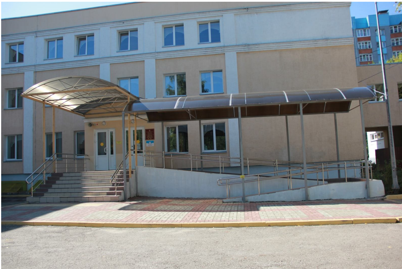
Пандус с двухуровневыми перилами к главной лестнице с кнопкой вызова персонала (для МГН)