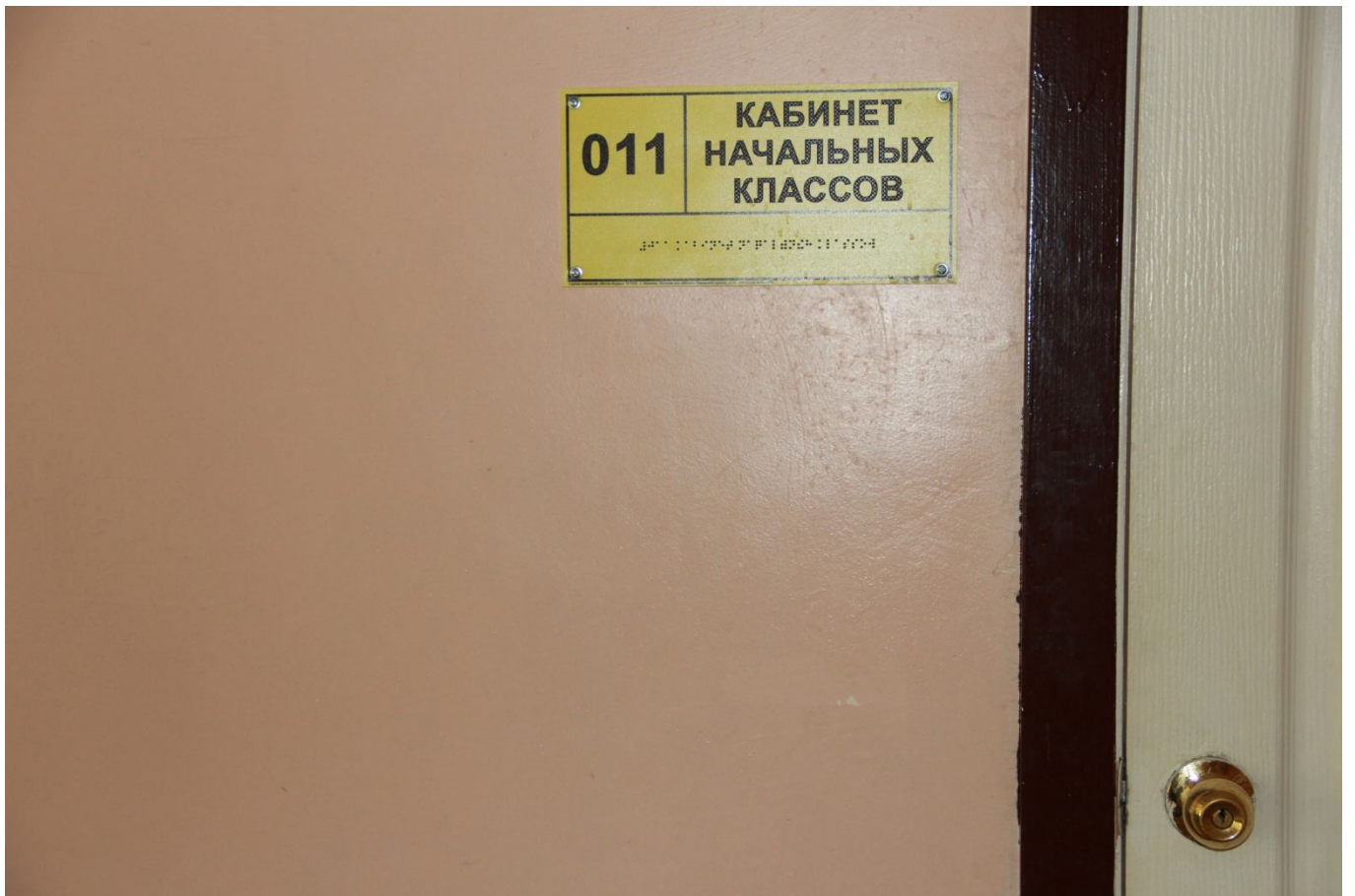
Универсальные информационные таблички у кабинетов, контрастная окраска дверных наличников