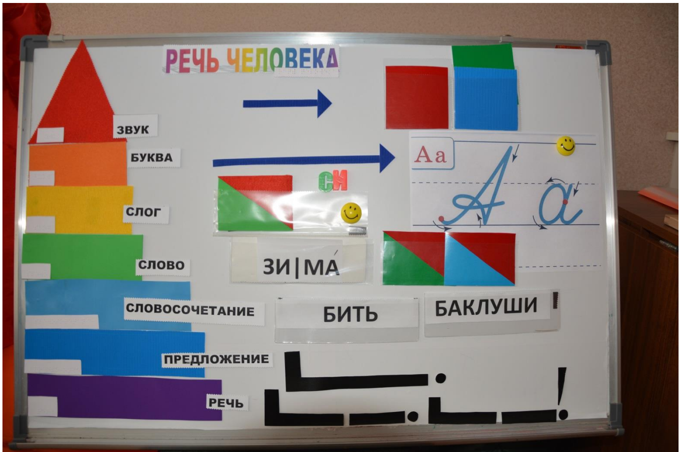
РЕЧЕВАЯ ПИРАМИДА (автор КОМАРОВА Т.П.)