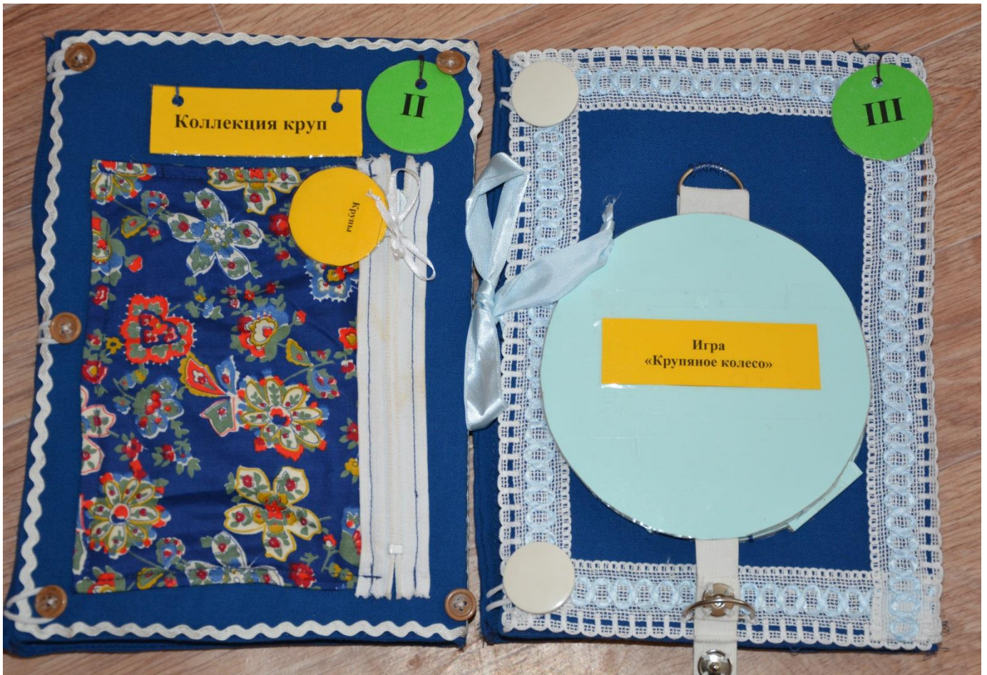
«ПОИГРАЕМ С КРУПАМИ» (автор БАКЛАНОВА Р.П.)