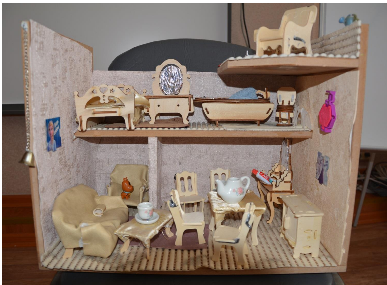
«МОЙ ДОМ» (автор ШЕСТАКОВА А.С.)