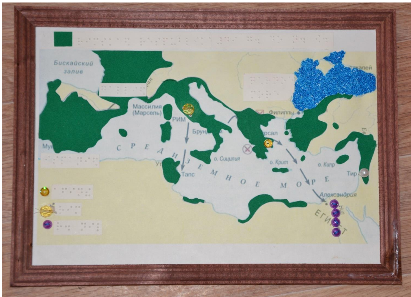
«КАРТА ПО ИСТОРИИ ДРЕВНЕГО МИРА» (автор БОРИСОВА А.С.)