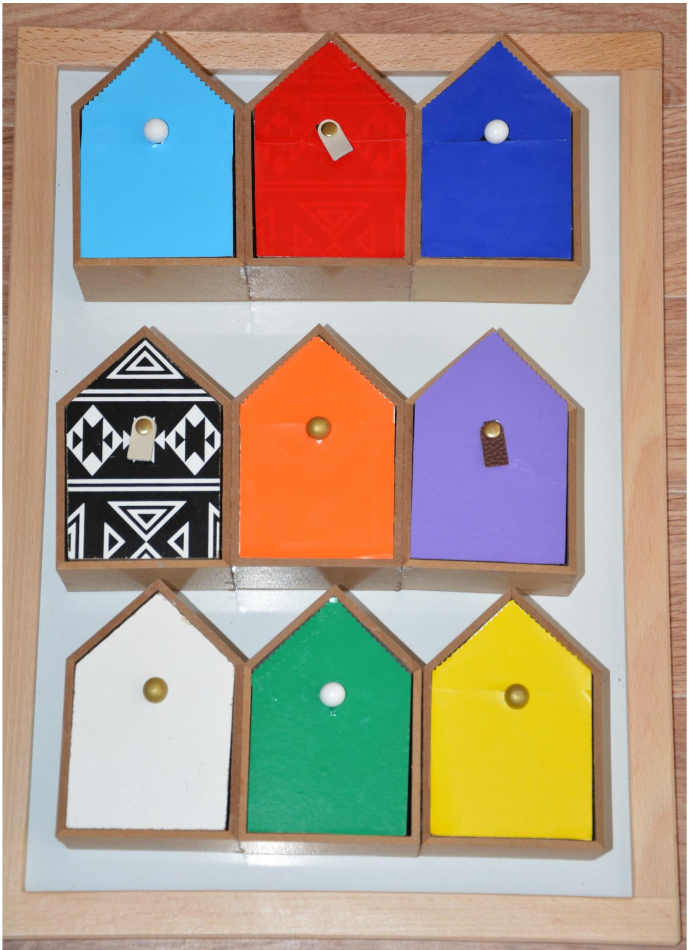
РЕЧЕВАЯ ПИРАМИДА (автор КОМАРОВА Т.П.)