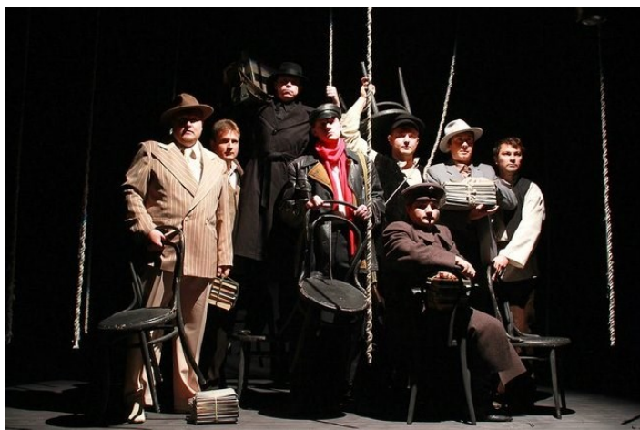
Спектакль «Поезд в страну негодяев»