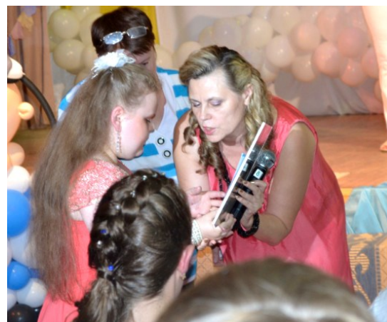
Вручение аттестатов 2015