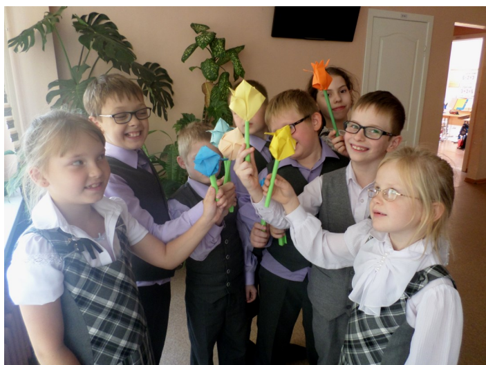
2 «А» готовит поздравление школе