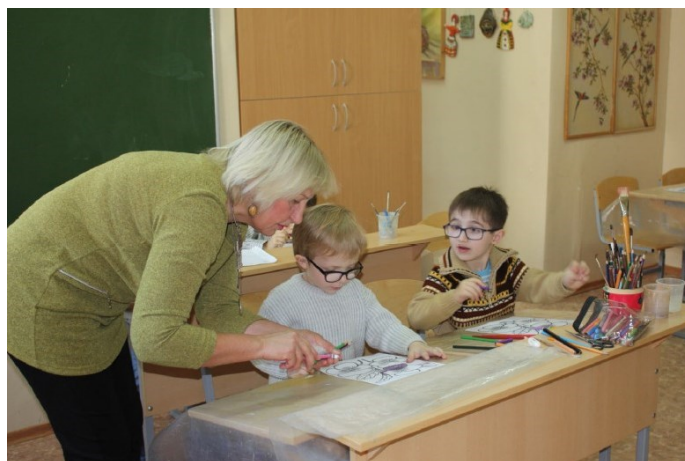
Занятие по лепке из глины

Мечта – это радуга, соединяющая Сегодня и Завтра.