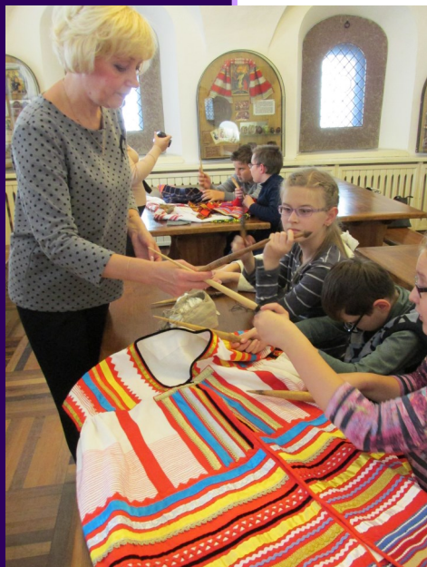
4 В исследует сарафан

В октябре 2015 года 4 В класс посетил историко-архитектурный музей-заповедник. Здесь ребята были уже не раз, совершая экскурсии и посещая те или иные экспозиции. Они в музее частые гости, не только посещают экскурсии, но