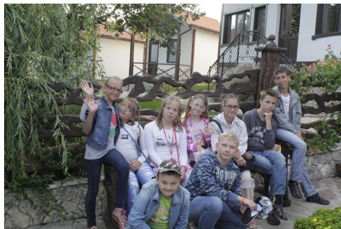
Коллектив школьного театра

В июне 2014 года, кукольный театр "Петрушка" принимал участие в XV Международном детском фестивале "Солнце. Радость. Красота." в городе Несебр (Болгария). По итогам конкурса коллектив награжден Дипломом и Памятным знаком за 1 место.