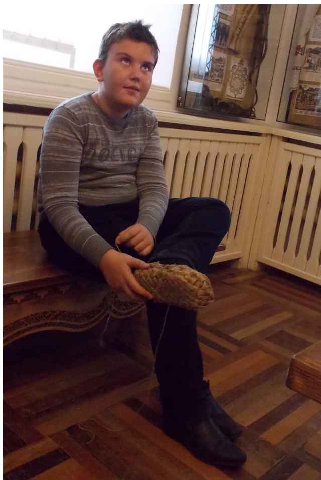
Ох, и лапти хороши! 4В в музее