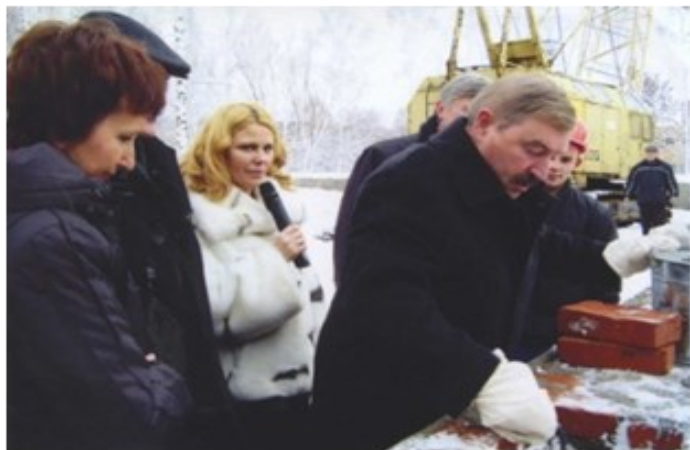
Закладка капсулы нового здания

...наши совместные усилия прорастут добрым зерном