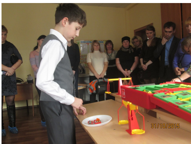
День открытых дверей