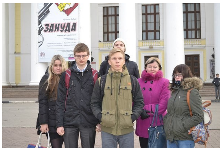
11 класс после спектакля