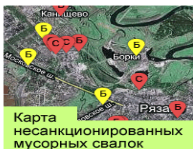
Карта несанкционированных мусорных свалок