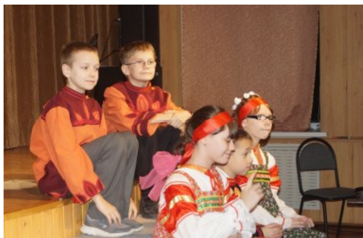
Фольклорный ансамбль «Авдотьюшка»

В понедельник, 16 ноября 2015 года, наша школа-интернат отметила свое 17-летие.