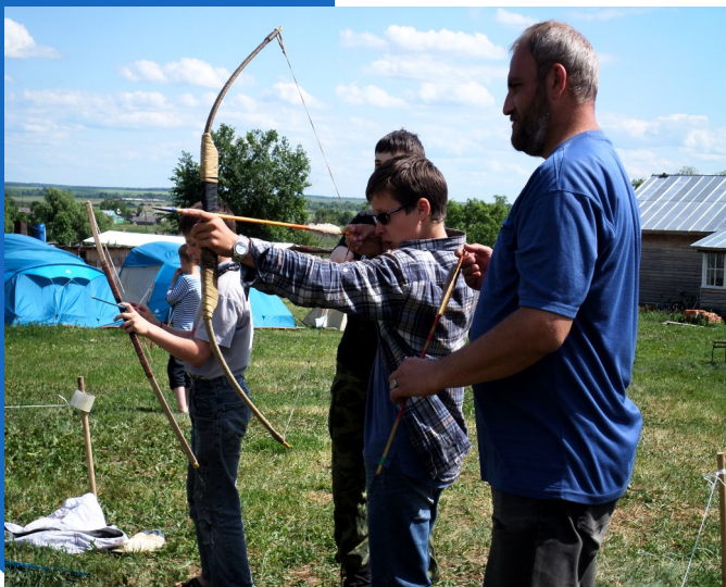
Стрельба из лука

Прошло почти три ме- сяца учебного года, а мы с одноклассниками часто вспоминаем летний этно- графический лагерь «Городище 2015».