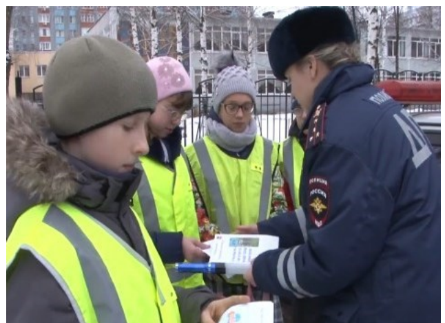
Инструктаж перед акцией

В этот же день, 4 декабря, с начальными классами была проведена беседа об использовании светоотражающих элементов. Ученикам подарили световозвращающие браслеты, чтобы они, будучи пешеходами, были более заметны на дорогах.