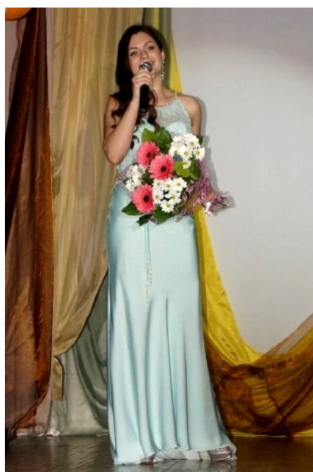
Поздравление от выпускников