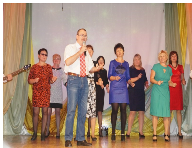
На сцене педагогический коллектив

Программа праздника порадовала присутствующих своим разнообразием и профессионализмом. Кульминацией стало выступление школьного ВИА "Огни".