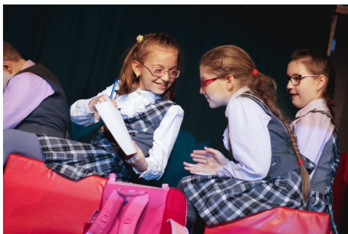
Спектакль «Сказка о потерянном времени»