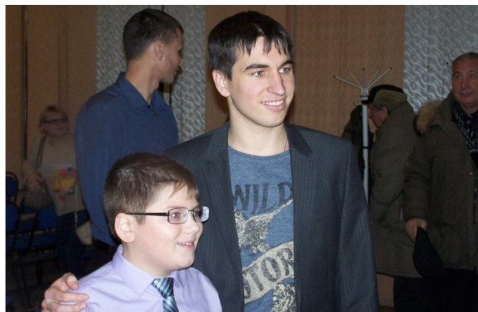
Встреча с гроссмейстером