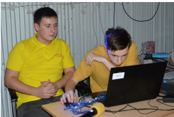
На школьной дискотеке