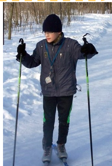
Вперед! К победе!