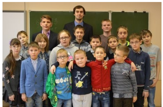
На соревнованиях по шахматам

А также 30 января прошел товарищеский матч по шахматам между ОГБОУ "Школа-интернат №26" и «Рязанский городской Дворец детского творчества». Ребята достойно защитили честь школы со счетом 6:3.