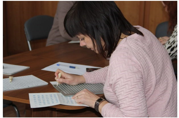
Педагоги пишут диктант