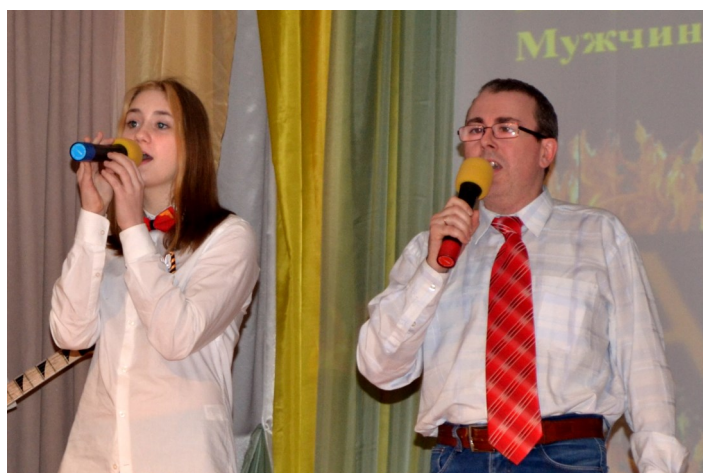
Выступление ВИА «Огни»