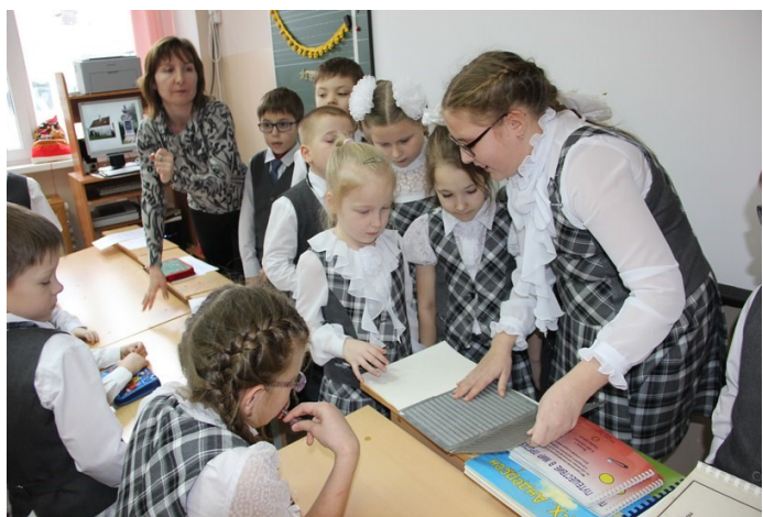
Классный час «Дитя ночи»