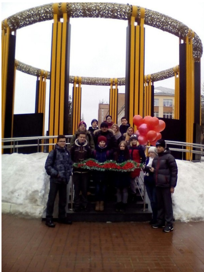
Акция «Красный тюльпан»