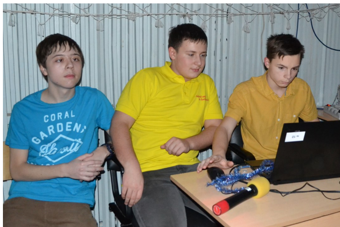
За диджейским пультом